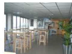
La salle du centre nautique (1440ko) Télécharger